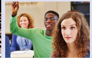
Individuelles Arbeiten mit 2-4 Kollegen und dem Tutor