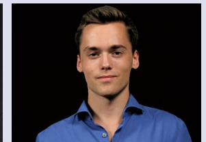
Über 150 Dokumente mehr, 3 Monate Auditone Premium-Support, Lösungen zu allen Aufgaben, psychologische Tipps für die Aufnahmeprüfungen und vieles mehr...