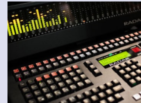
Grundlegendes Wissen in allen Prüfungsfächern

Mit diesem Kurs deckt der Bewerber mehr als alle prüfungsrelevanten Anforderungen ab und lernt mit originalgetreuen Mustertests der jeweiligen Universität. Die Basis-Kurse werden für die HfM Detmold, UdK Berlin und mdw Wien (Prüfungen im Juni/Juli) angeboten.