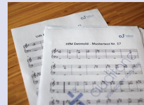
Erstklassige Dokumente von Auditone

Alle Pro-Kurse fokussieren sich auf die Vorbereitung für zwei Universitäten gleichzeitig. Jeder, der seinen Studienplatz nicht von nur einer Prüfung abhängig machen möchte, kann somit die Chancen auf sein Traumstudium um ein Vielfaches erhöhen.